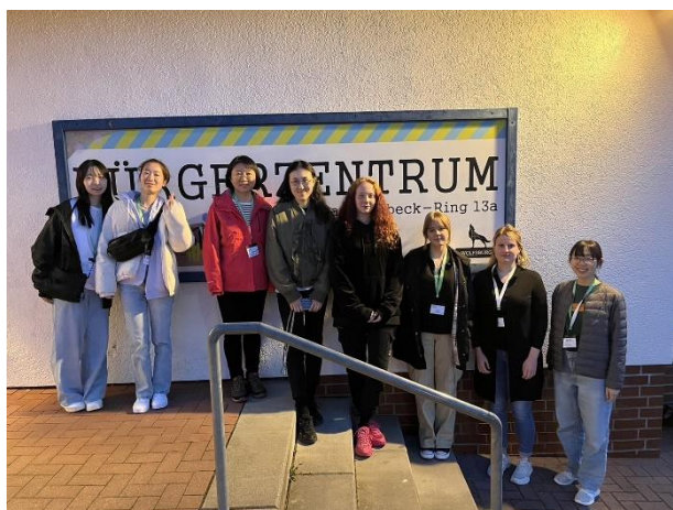
ユースセンターにて

また、ヴォルフスブルク市の要であるフォルクスワーゲンの工場も訪問しました。工場見学では、大きなオープンカーに乗って工場内をガイドさんの案内付きで回りました。工場はとても大きく、廊下には至る所に自転車が置いてありました。もう一つの公共施設は